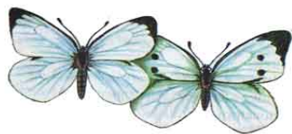
Слева - самец капустницы, справа - самка капустницы

Размер бабочки 32 мм. Самая обычная белянка. Черные с желтым гусеницы живут скоплениями на капусте и сильно вредят посевам. Полет быстрый. У самца на крыльях нет черных пятен, которые характерны для самки. Испол самцов и самок похож, задние крылья желтоватые, передние — белые с двумя черными точками.